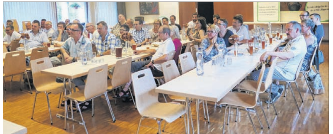
Die zweite ordentliche Generalversammlung im Pfarreiheim wurde von über 40 Genossenschaftlern besucht.

ganzen «BiBo-Land» kosten sollen) soll in der Öffentlichkeit präsent(er) sein. Sämtliche Jahresberichte (wie auch der Kassen- und Revisorenbericht) wurden einstimmig genommen. Und nach genau